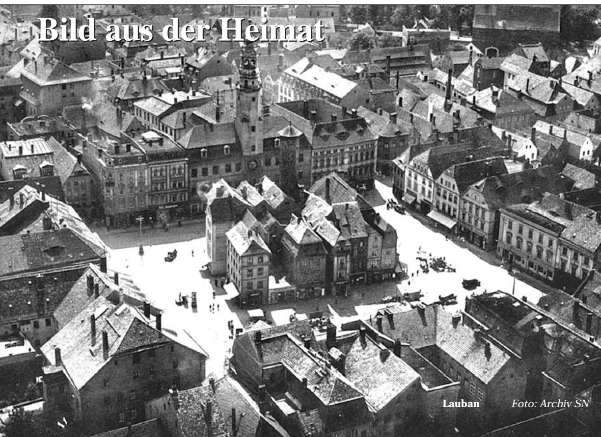
Bild aus der Heimat

wurde dies nun ganz ausgeschlossen. Schröder verkündete sogar öffentlich, auf internationale und nationale Gerichte bei Klagen von Vertriebenen einwirken zu wollen. Welche Erwartungen können wir jetzt an die neue Koalition aus Union und FDP haben? Ist Wesentliches für uns zu erwarten, wenn CDU/CSU von der Fessel SPD befreit sind? Um diese Fragen beantworten zu können, muß man sich in Erinnerung rufen, was führende Politiker zu unseren Fragen bisher geäußert haben. Generell gilt die