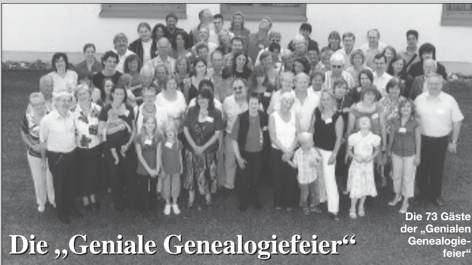
Die 73 Gäste der „Genialen Genealogie- feier“

Unsere Mutter starb 2002, aufgrund dieses einschneidenden Erlebnis führte mich mein Urlaub 2002 nach Schlesien, wo meine Mutter herstammte. Ich interessierte mich zum ersten Mal wirklich für die Herkunft unserer Eltern. Die Eltern waren Vertriebene, die