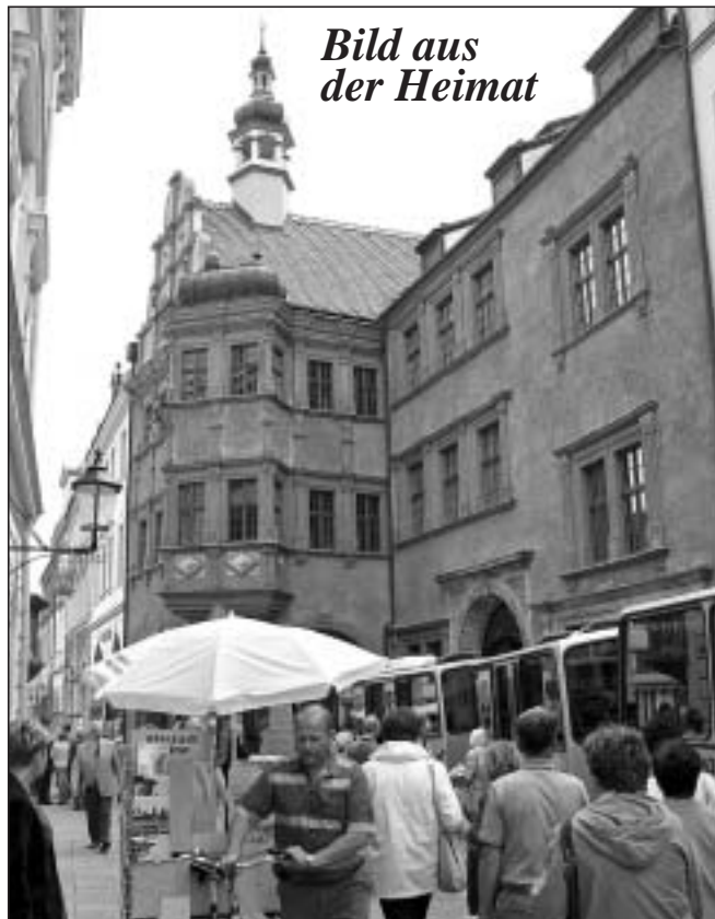
Bild aus der Heimat

Selbstverständlich darf nicht gleich verallgemeinert werden, überall un-ter jungen Deutschen, unter einer Mehrheit von Mitbürgern und Zeit-genossen sehe es so aus, dass man erstens gar nichts von Schlesien weiß, zweitens auch gar nichts wis-sen will, drittens trotzig und erstaunt fragt, „Was wäre daran denn so tra-