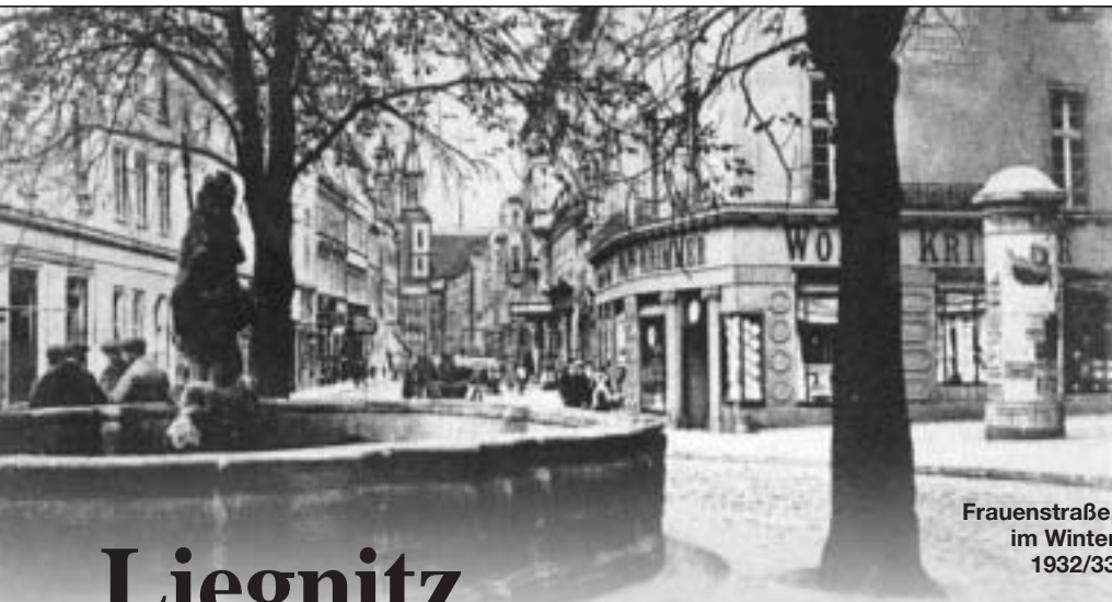
Frauenstraße, im Winter 1932/33

Nachdem die Bereitstellungsräume und die Angriffstreifen für die Kompanien festgelegt waren, ging es bei einbrechender Dunkelheit zurück nach Krappitz. Im Schloß beim Stab der Gruppe Süd gab es die letzten, endgültigen Befehle: Am 21. Mai, 2.30 Uhr früh wird angegriffen. Angriffsziel: Der Annaberg! Nüchtern betrachtet mußte dieser Angriff von sieben Bataillonen ohne alle schweren Inf.-Waffen, ohne jede Artillerie, gegen einen vierfach überlegenen Feind in ausgebauten Stellungen, von jedem Generalstab als glatter Wahnsinn bezeichnet werden. Er mußte einfach unter schweren Verlusten scheitern. Fortsetzung folgt!