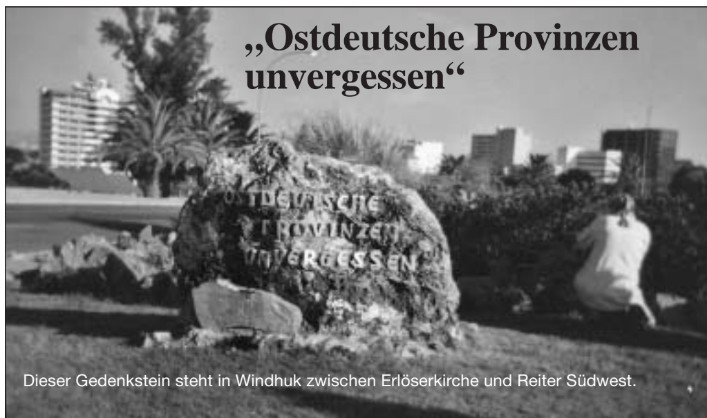
Dieser Gedenkstein steht in Windhuk zwischen Erlöserkirche und Reiter Südwest.