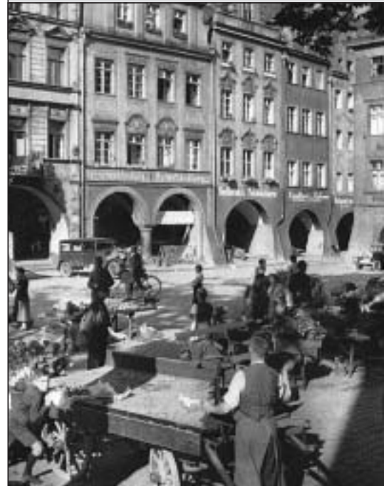
Im Hirschberg des Jahres 1927 wurde die Schriftstellerin Erle Bach geboren. Wir gedenken ihres 10. Todestages am 27. Mai 2006 auf Seite 11 mit einem Artikel von Konrad Werner.

Wochenmarkt in Hirschberg