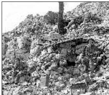
Eindrucksvolles Foto von Helmut Riemann: Der einzelne Mensch erscheint klein und hilflos angesichts der Größe eines Bombentrichters.