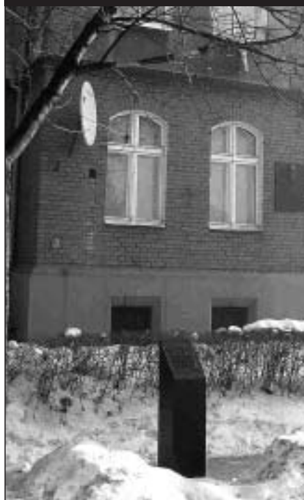
Das Geburtshaus von Horst Bienek mit der polnischen Gedenktafel und der deutschen Übersetzung auf den Sockel vor dem Haus auf der Straße

burtshaus von Bienek an der gleichen Stelle wie vorher an. Direkt an der Straße vor dem Haus, auf einem schräg abgeschlossenen ca. 1 Meter hohen Sockel, ist eine kleine Gusstafel (ca. 20x20 cm) mit einer deutschen Inschrift angebracht. Leider hat man sich bei der deutschen Übersetzung nicht für das deutsche Wort „Gleiwitz“ entscheiden können. Nur das polnische Wort. J. Golawski (SN)