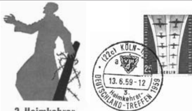
3. Heimkehrer Deutschlandtreffen