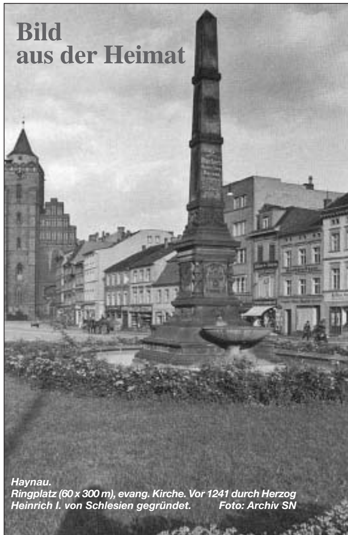
Haynau. Ringplatz (60 x 300 m), evang. Kirche. Vor 1241 durch Herzog Heinrich I. von Schlesien gegründet.