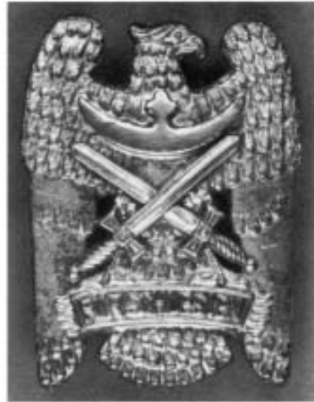
Das schlesische Bewährungsabzeichen (Schlesischer Adler) wurde Selbstschutzkämpfern in zwei Stufen verliehen.

unter Führung des von der polnischen Minderheit gewählten ehemaligen Mitglieds des Deutschen Reichstages Wojciech (Albert) Korfanty begannen die deutsche Bevölkerung durch Terror und leere Versprechungen, die sehr oft auch von den Kanzeln verkündet wurden, für die polnische Sache zu gewinnen. Um die beabsichtigte Abstimmung durch vollendete Tatsachen unmöglich zu machen, wurde in der Nacht vom 16./17. August 1919 der „erste polnische Aufstand“ – auch „Überfall“ genannt – ausgerufen. Dieser wurde bis zum 25. August 1919 vor allem durch den deutschen Grenzschutz und von der Reichswehr niedergeschlagen. Am 11. Februar 1920 wurde die Verwaltungsmacht in Oberschlesien, das am 8. November 1919 zu einer selbständigen Provinz erklärt wurde, der „Interalliierten Kommission für Regierung und Abstimmung“ übertragen. Die Reichswehr musste das Abstimmungsgebiet räumen,