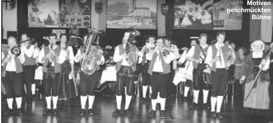
„Die fidelen Musikanten“ vor der mit schlesischen Motiven geschmückten Bühne

Das 22. Herbst- und Baudenfest der Landsmannschaft Schlesiens, Kreisgruppe Neuss, stand in diesem Jahr unter einem besonders