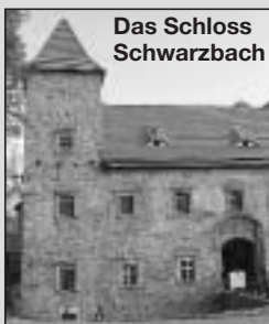
Das Schloss Schwarzbach