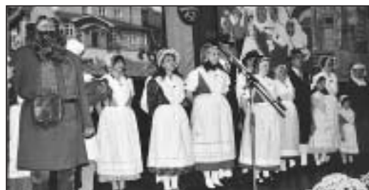
Rübzahl mit der Volkstanzgruppe „Der fröhliche Kreis“ aus Bergisch Gladbach auf der bunt geschmückten Bühne

Im weiteren Verlauf des ersten Teiles des stimmungsvollen Abends trat die Trachtengruppe „Der fröhliche Kreis“ auf. Nicht aus