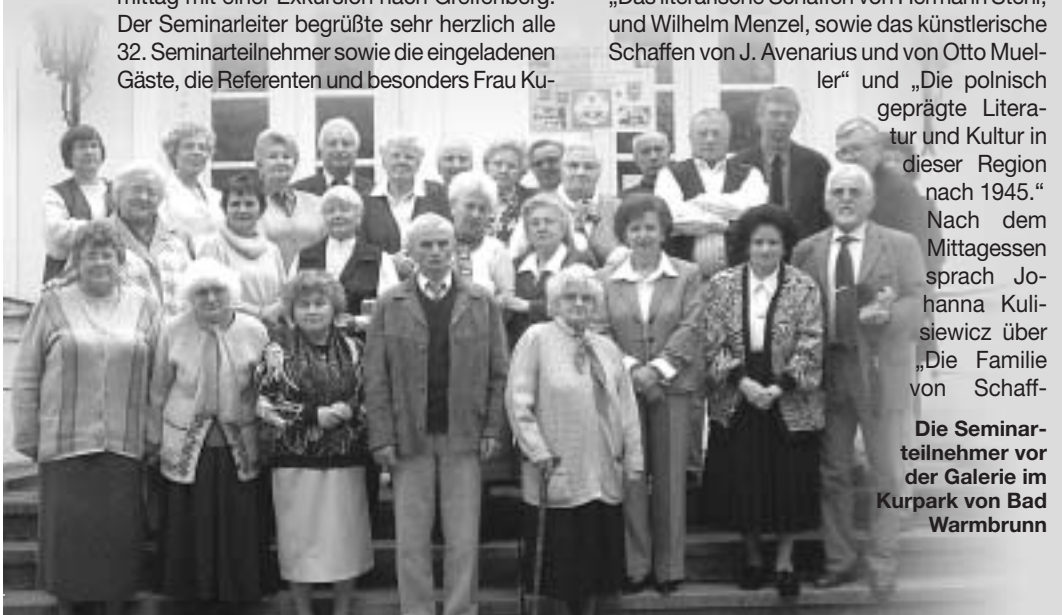
Die Seminarteilnehmer vor der Galerie im Kurpark von Bad Warmbrunn