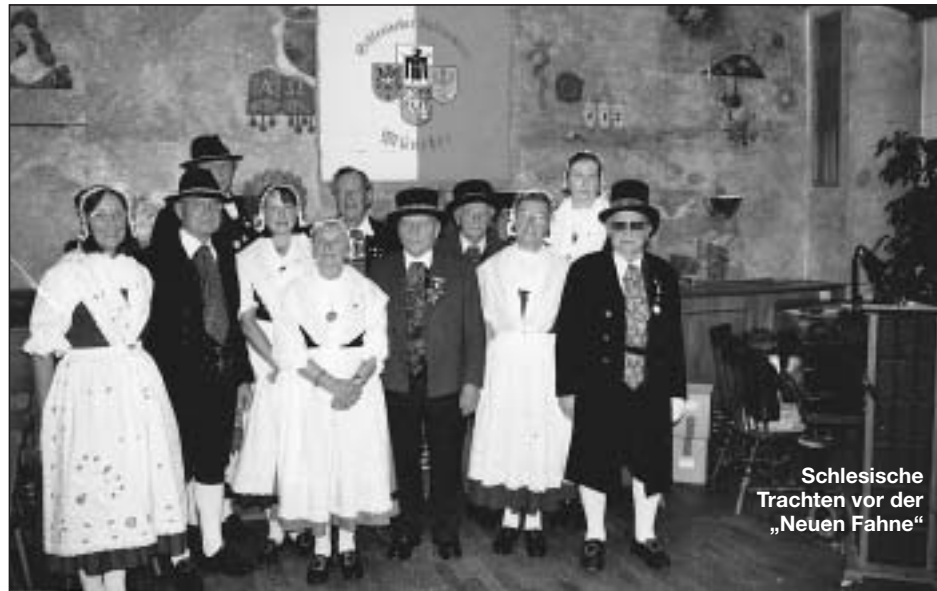
Schlesische Trachten vor der „Neuen Fahne“