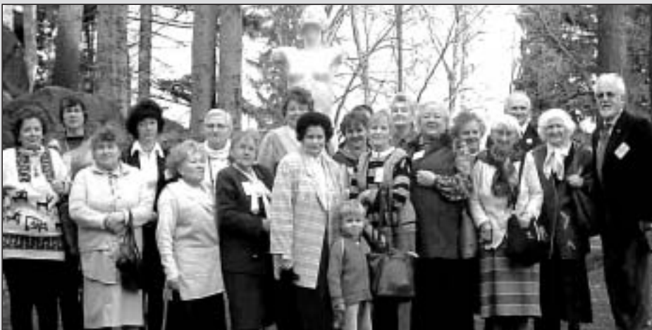
Die Seminarteilnehmer im Garten der Villa Wiesenstein vor der Plastik der Hannele