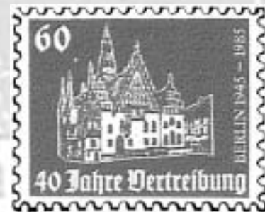
Das Breslauer Rathaus im spätgotischen Stil erbaut