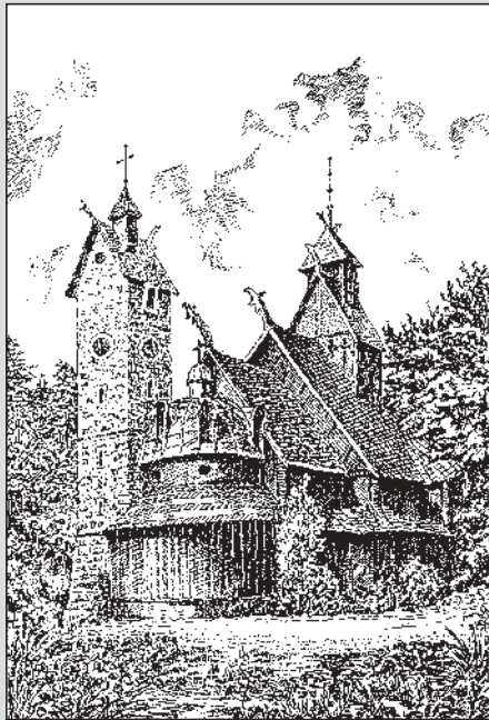
Kirche Wang / Brückenberg im Riesengebirge

Holz. Die steilen, kurzen, weit vorspringenden Dächer schützen das Holzwerk gegen große Schneemassen, Regen und Feuchtigkeit und vor Stürmen des nordischen Klimas. Ein Umgang schützt die wertvollen Schnitzereien und bietet den Kirchenbesuchern vor und nach Gottesdienst Schutz. Starke Eckmasten, die wie Schiffsmasten in Zapflöchern stecken, tragen das steile Dach und die aus senkrechten Planken bestehenden Stabwände – daher der Name Stabkirchen. Das Dach bekrönt ein Dachreiter, der auch als Glockenturm dient und mit Drachenköpfen, wie die Bugfigur der Wikingerschiffe, verziert ist. Die Dächer sind mit kleinen Holzschindeln gedeckt und ebenfalls mit Dachreitern verziert. Der ganze Bau erinnert an ein aufgetakeltes Schiff und der Dachstuhl an den umgekehrten Kielraum. Das Kircheninnere ist weniger verschwenderisch als die Portale ausgestattet. Schnitzereien finden wir nur an den als besonders wichtig hervorzuhebenden Stellen. Hier finden wir neben herrlichen Ranken- und Blumenmustern, Drachen, Löwen und Adler. Wie viele ihrer Schwesterkirchen, veränderte auch die Kirche