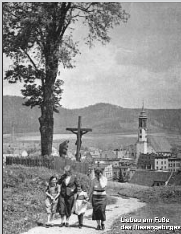
BILD AUS DER HEIMAT

Wir wünschen unseren Leserinnen und Lesern ein Frohes Osterfest!