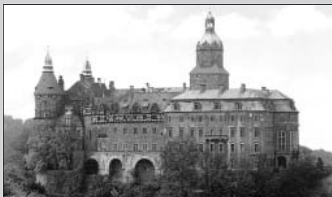
„Schloß Fürstenstein“ wurde 1242 vom Bolko I. auf steiler Berghöhe angelegt. Im Laufe einer jahrhundertlangen Entwicklung entstand die größte Schloßanlage Schlesiens, seit Jahrhunderten im Besitz der Grafen von Hochberg (seit 1847 Fürsten von Pleß). Das Schloß ist umgeben von großzügig gestalteten Terrassen und Gärten. Auch heute noch ist Schloß Fürstenstein ein beliebter Anziehungspunkt für viele Besucher aus dem In- und Ausland.