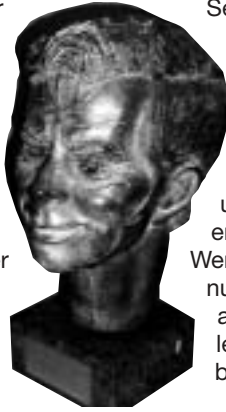
Ein Selbstporträt des Künstlers als Bronzeplastik.