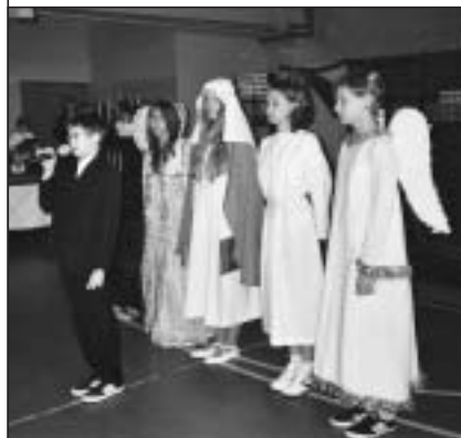
Grundschule Nr. 17 Sohrau