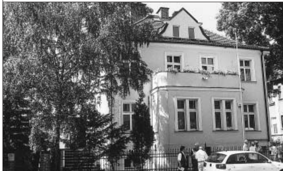
Haus des DFK Breslau in Breslau

In der katholischen Pfarrei St. Marien in Detmold / Ostwestfalen ist es zur guten Tradition geworden, am 4. Dezember eines jeden Jahres zum Barbaratag einzuladen. So auch dieses Jahr: Bei der Barbaramesse standen fünf Priester am Altar, knapp zweihundert Besucher kamen. Die Barbarafeier fand anschließend