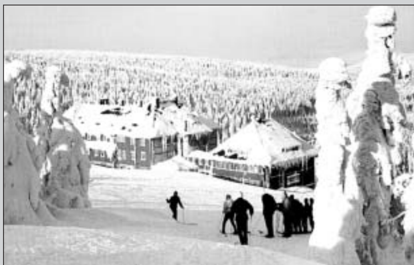
Winterfreuden an der Neuen Schlesischen Baude (1195 m) zwischen Zackelfall und Reifträger.