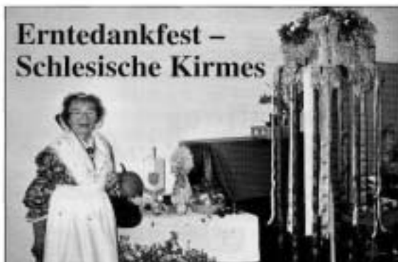
Schlesische Kirmes bei der Kreisgruppe Darmstadt-Dieburg

Die Landsmannschaft Schlesien, Kreisgruppe Darmstadt-Dieburg, hatte im Oktober 2004 zu ihrem Erntedankfest und zur Schlesischen Kirmes eingeladen. Zahlreich waren die Schlesier und auch Nichtvertriebene zu dieser besonderen Veranstaltung gekommen, teilweise in der traditionellen Riesengebirgstracht. Um die Kirmes gebührend zu feiern, standen nicht nur Lieder und Gedichte - teils auch in Mundart gesprochen - auf dem Programm, sondern auch Tanzdarbietungen vorgetragen vom Verein Deutsche Jugend aus Russland. Die Mädchen und Jungen begeisterten die Anwesenden mit einem Tanz aus Lettland und einem Tanz, der das Lebensgefühl der Tundra vermitteln wollte.