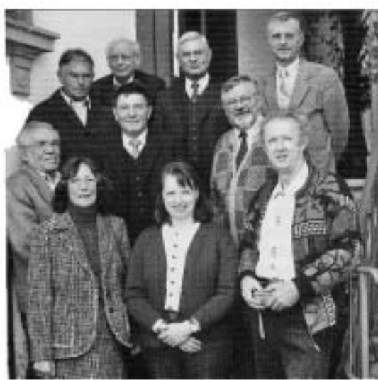
Europaminister Sinner im Kreise der schlesischen Abordnung

Am 24. 9. 2004 trafen sich Vertreter des Landesvorstandes und örtliche Funktionsträger der Landsmannschaft Schlesien, Landesverband Bayern, im Haus der Banater Schwaben in Würzburg-Heidingsfeld mit dem Bayerischen Europaminister Eberhard Sinner zum Gedankenaustausch über die Schlesier, die Vertreibung und ihre Folgen und denkbare Zukunftsperspektiven im erweiterten Europa.