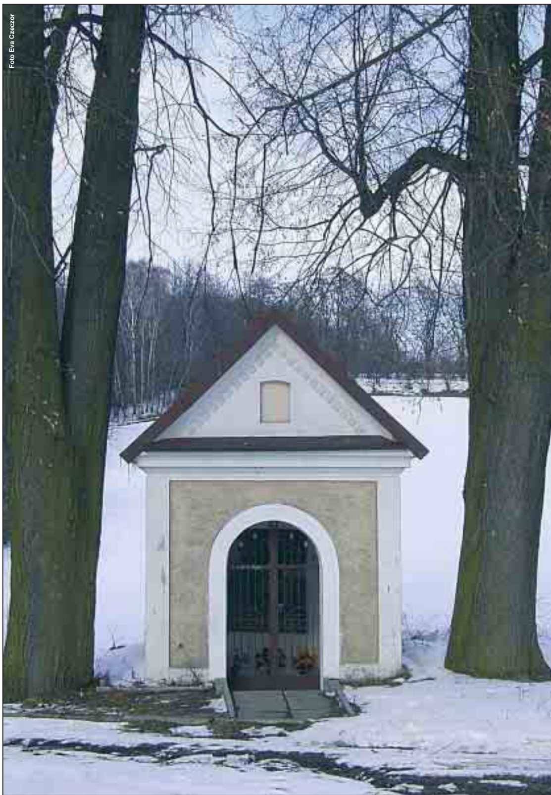
Drei-Brüder-Kapelle zwischen Deschowitz und St. Annaberg

ZEITUNG FÜR DIE OBERSCHLESIER IN OST UND WEST