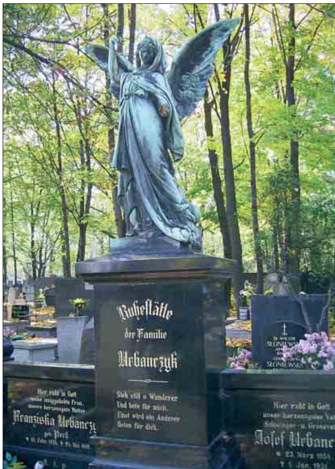
Renoviertes Familiengrab auf dem Friedhof Mater Dolorosa in Beuthen

ZEITUNG FÜR DIE OBERSCHLESIER IN OST UND WEST