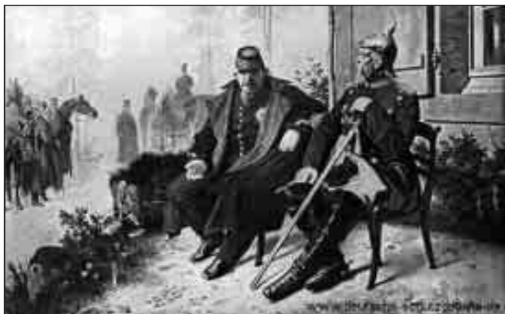
Otto von Bismarck (re.) mit dem in Gefangenschaft geratenen Kaiser Napoleon III. bei Sedan am 2. September 1870.

E in Ereignis in seinem langen Leben erfüllte Hugo v. Ruffer mit besonderem Stolz: Am 2. September 1870, nach der Schlacht bei Sedan, begleitete er gemeinsam mit Otto v. Bismarck den gefangen genommenen französischen Kaiser Napoleon III. zum preußischen König Wilhelm nach Wilhelmshöhe bei Kassel und überbrachte den kaiserlichen Degen als Zeichen des Sieges. Für seine „Tapferkeit“ wurde er mit dem Eisernen Kreuz belohnt, eine Auszeichnung von vielen, die er aber bei jeder Gelegenheit an der Brust getragen haben soll. Am 3. Oktober 1930, um 20 Uhr, starb Ruffer und damit auch der letzte Augenzeuge dieses denkwürdigen Ereignisses im Deutsch-Französischen Krieg von 1870/71. Mit ihm starb zugleich der Nestor des schlesischen Adels. Im Jahre 1884 übernahm Ruffer, der am 7. April 1844 als ältester Sohn des Geheimrats Heinrich v. Ruffer geboren wurde, nach dem Tode seines Vaters die Majorats-herrschaft Rudzinitz; hier bekleidete er fortan zahlreiche Ehrenämter. Er war Kirchenpatron, Amts- und Gemeindevorsteher. Jahrzehntlang gehörte er dem Kreistag an,