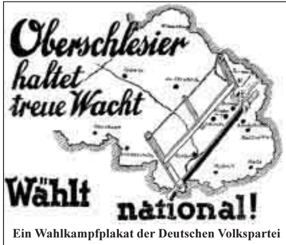
Ein Wahlkampfplakat der Deutschen Volkspartei

Reichstagswahlen. 1928 erzielte die Partei rund 17 Prozent, was deutlich über dem Reichsergebnis lag. Die größten Erfolge mit um die 30 Prozent errang sie in der Arbeiterstadt Hindenburg, aber auch in kleinen Industrieorten wie etwa Miechowitz. Dagegen spielte die NSDAP eine kaum beachtenswerte Rolle. Die Rechtsextremen, die außerhalb Oberschlesiens durch Aufmärsche, Gewalttaten und Haßausbrüche ihrer Führer für Furore und Angst sorgten, erzielten bei den Provinziallandtagswahlen 1929 gerade einmal etwas mehr als 2 Prozent. Das änderte sich aber am 14. September 1930. Die NSDAP gewann im Wahlbezirk Oppeln 9,5 Prozent und verzehnfachte ihr Ergebnis von 1928 (bemerkenswert: im Wahlbezirk Oberschlesien gewann die Hitlerpartei immer noch 23.000 Stimmen weniger als in der Stadt Breslau!). Die KPD konnte