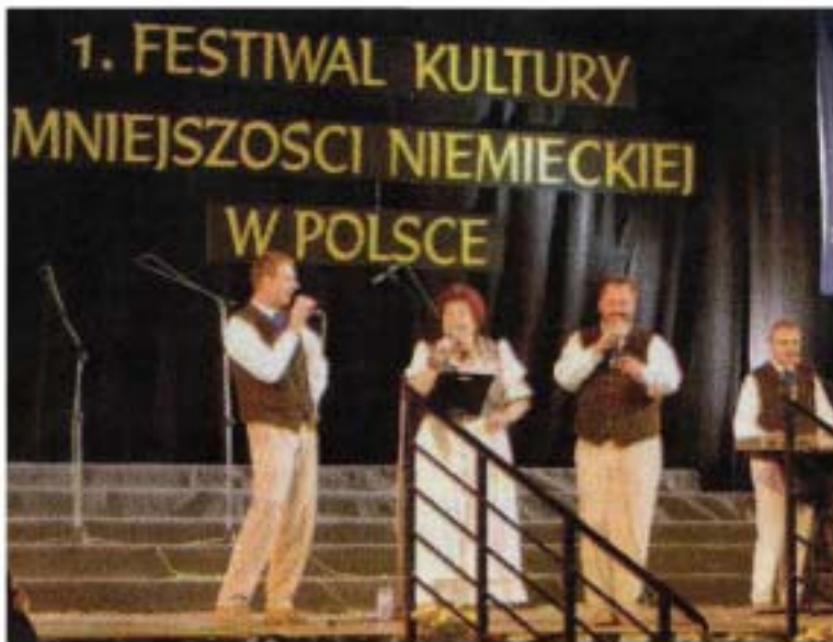
Auftritt des Proskauer Echo

Der VdG verzichtete angesichts der durch die Debatte um das geplante „Zentrum gegen Vertreibungen“ in Polen aufgeheizten Stimmung auf politische Reden. Der VdG sagte bereits im Vorfeld des Kulturfestivals, daß keine Vertreter des Bundes der Vertriebenen (BdV) oder von Landsmannschaften eingeladen wurden. VdG-Präsident Friedrich Petrach gab allerdings in der „Gazeta Wyborcza“ zu verstehen, daß man nicht verhindern könne, sollten Mitglieder des BdV an der Veranstaltung teilnehmen. Bei der offiziellen Begrüßung nannte Petrach zwar Gäste aus Deutschland, wie beispielsweise den SPD-Bundestagsabgeordneten Markus Meckel, jedoch nicht den ebenfalls ange-reisten Bundesvorsitzenden der Landsmannschaft Schlesien, Rudi Pawelka, dessen Teilnahme bei den Veranstaltern mit gemischten Gefühlen aufgenommen wur-