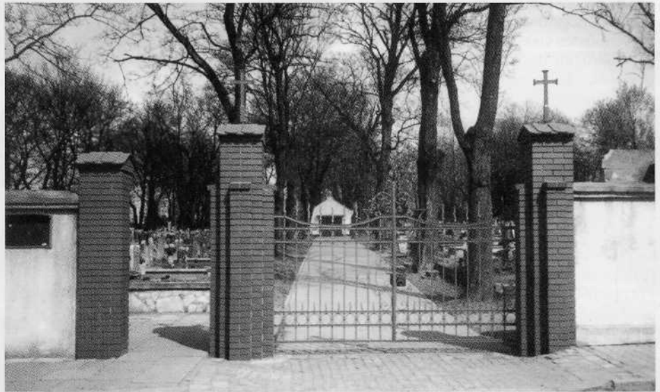
Eingang Friedhof Hindenburg

1861 In Biskupitz mit der Kolonie Borsig-