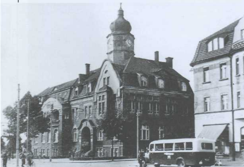
Das alte Rathaus von Klausberg wird heute als städtisches Verwaltungsgebäude genutzt