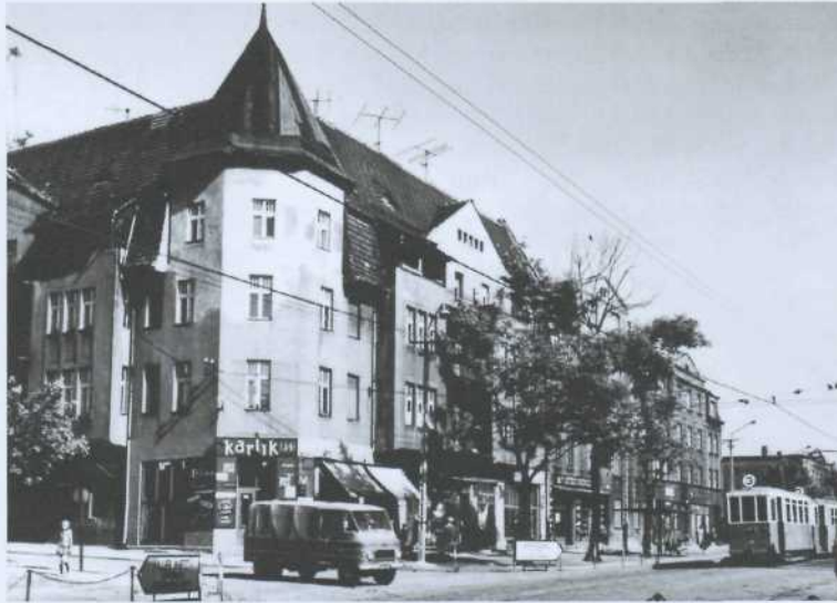
Die Hauptstraße mit der Straßenbahn Richtung Hindenburg

1780: 56 Bauern-, 12 Gärtnerstellen, 379 E.; 1797: 524 E.; 1819: 556 E.; 1830: Anton v. Raczecksche Erben, 116 H., Vorwerk mit Schäferei, Kirche, Schule, 2 Wassermühlen, Sägemühle, 681 E.; 1843: 1080 E.; 1855: 1343 E.; 1858: 1735 E.; 1861: 1650 E.; 1864: 5 Halbbauern-, 28 Gärtner- und 72 Häuserstellen, 2 Vorwerke (Neuhof, Wessolla), Kalkofen, Ziegelei (Dach- und Mauerziegel, Drain-Röhren), Forsthaus, Kirche, Schule; 1871 :2714E.; 1885: 3383 F.; 1900: 7064 E.;