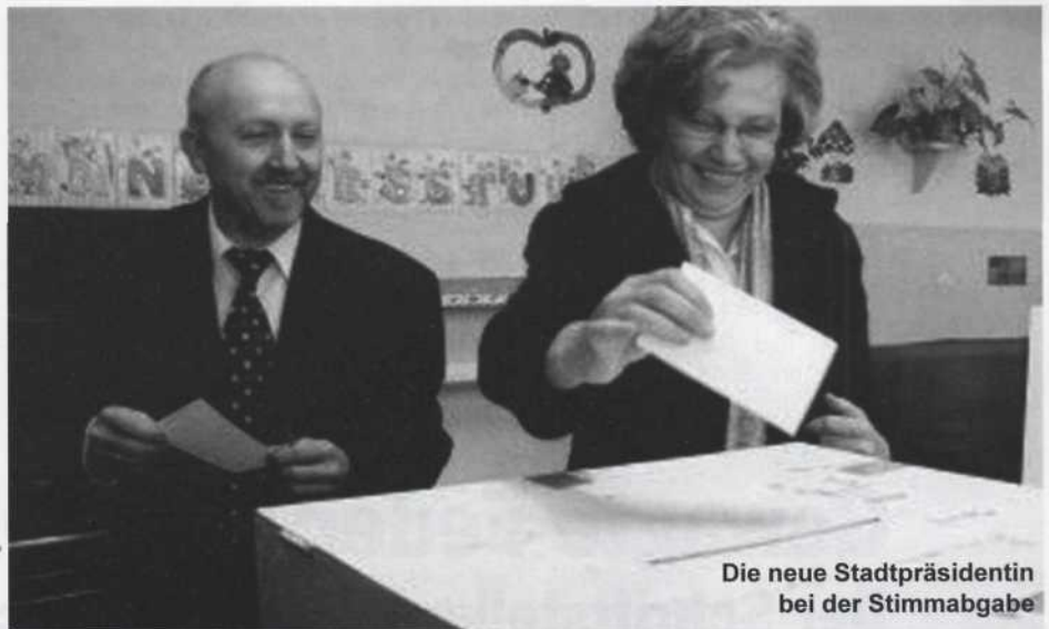
Die neue Stadtpräsidentin bei der Stimmabgabe