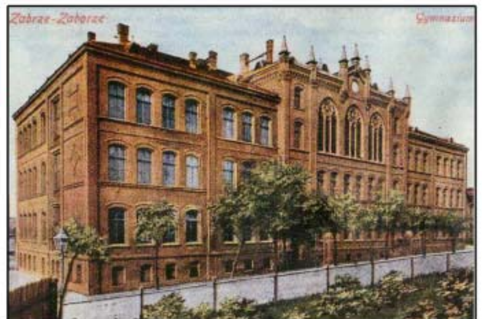
Hindenburg-Zaborze damals, das Gymnasium