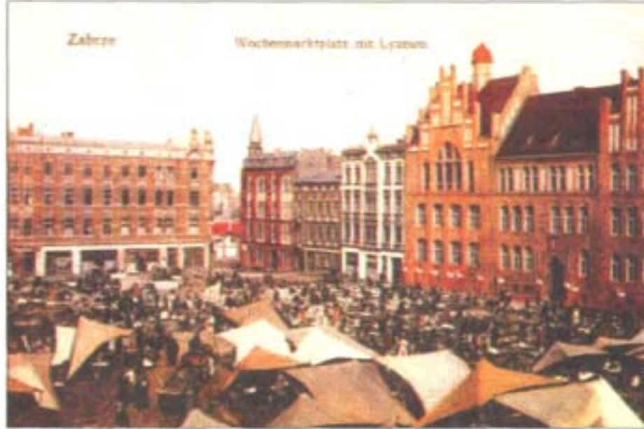
Hindenburg damals: Wochenmarktplatz mit Lyzeum

Kleingartenanlagen, Kirche, Friedhof, Marktplatz, Sportanlagen und kleine Parks befinden. Das trug der späteren Stadt den Beinamen „Werkstatt im Grünen“ ein. Außerdem ist zu vermerken, daß nach 1933 die alten Ortsteilnamen wie Dorotheendorf durch die Bezeichnung Stadtteil Süd, Biskupitz durch Stadtteil Nordost, Zabrze durch Stadtteil Ost ersetzt wurden. Die Bevölkerung hat diese Namen in ihrem Sprachgebrauch allerdings nie angenommen. Bei den Hindenburger Heimattreffen beschwerten sich die Besucher über die für sie noch heute ungewohnte Ausschilderung der Stadtteile.