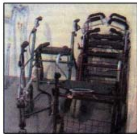
Rehabilitationsgeräte, die in der Sozialstation ausgeliehen werden können.