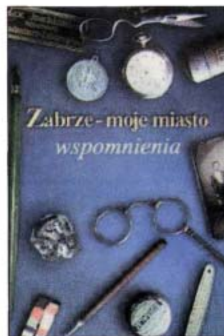
Namensgebung: im deutschen Hindenburg war es schwer, jemanden auf den Vornamen Stanislaw zu taufen (darüber schreibt Stanis-

sich im deutschen Hindenburg an, oder umgekehrt fühlten sich als Deutsche im polnischen Zabrze. Einige erinnern deutsch-polnische Zwistigkeiten als nicht zu heilende Wunden, andere Kinderschlachten mit Steinen am Fluß Scharnafka. Typisch sind Probleme mit der