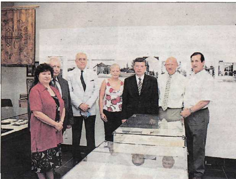
Gäste aus Hindenburg OS und einige Mitglieder des Vertretungsausschusses "Hindenburg OS" bei der Patenstadt Essen im "Hindenburg Heimatmuseum" in Essen. Erstmals besucht ein polnischer Stadtpäsident von Hindenburg OS die heimatische Sammlung der Hindenburger in deren Patenstadt.