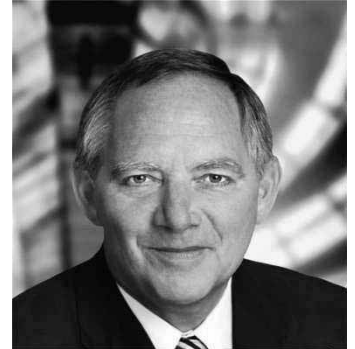
Dr. Wolfgang Schäuble

Inszenierens fragwürdigen Selbstbewusstseins muss es doch deutscher Außenpolitik zuvorderst darum gehen, für Vertrauen unter den europäischen Partnern zu sorgen, das letztlich auch der wichtigen Stabilität in den Beziehungen der EU zu Russland zugute kommt. Dazu gehört auch ein überlegter Umgang mit der